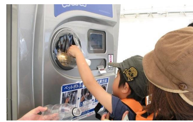
ペットボトル回収機でポイントを発行(市内9か所)