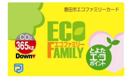
エコファミリーカードにポイントが貯まります

環境配慮行動に取り組む家族に「エコファミリー宣言」をしてもらい、エコファミリーに登録する制度です。楽しみながらエコライフに取り組む家族を市内全域に広げ、CO 2 の削減を目指します。