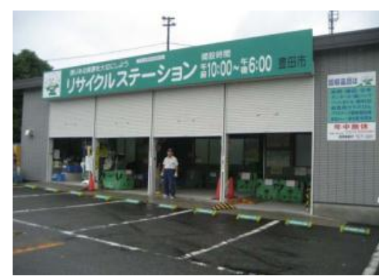
リサイクルステーションに資源を持ち込むと1日5ポイントを発行