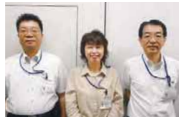
お客様サービス部のメンバー

お客様サービス部は年中無休でお客様の声をお聞かせいただけるよう対応しています。よりたくさんのお客様の声をお聞きし、なおいっそう従業員の意識を高め、お客様に気持ち良くお買い物をしていただけるよう努めてまいります。