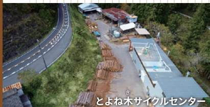
とよね木サイクルセンター

大きい丸太は市場に運ばれますが、細い丸太は森林組合の加工場で板材や角材にされ、地元の人向けに販売されます。貴重な資源である丸太を無駄にはしません。