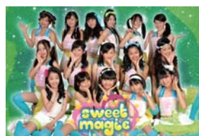
ESD sweet magic

ご当地アイドル&人気アイドル大集合！ 「La花ノたみ」「ESD sweet magic」「しず風 & 絆」 その他アイドル多数集合