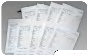
全校アンケート調査のアンケート用紙

調査や講義を通して、テーマである「環境に良い紙とはなにか」の答えは一つではないことがわかりましたが、「正しい分別による古紙リサイクルの推進」が重要であると感じました。なお、家庭での分別状況の調査では、分別リサイクル資源として再活用されている品目、リサイクルできるのに可燃ごみとして出されてしまっている品目を具体的に把握することができました。