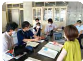
調査データの考察