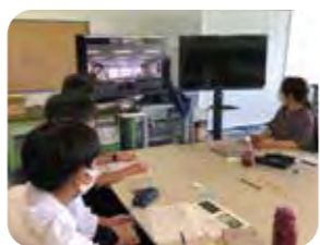
専門家からの講義①