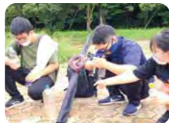
水においの嗅ぎくらべ