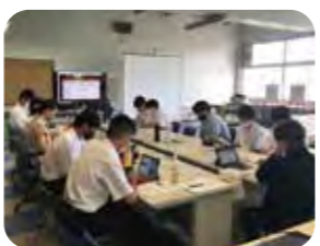
専門家からの講義②