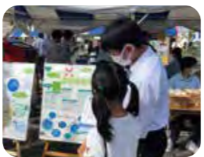
小牧市民まつりでの展示②