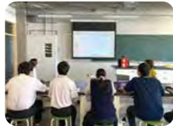
調査方法のレクチャー

今後はにおいの発生理由の調査を進めていきます。発生理由が分かれば、臭気の改善に繋がられ、池周辺の大気環境の改善に貢献できると考えています。