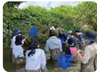
調査方法のレクチャー

夏から秋にかけて採捕できる種数が減少しました。これは水温が低下したことが原因ではないかと考えられました。