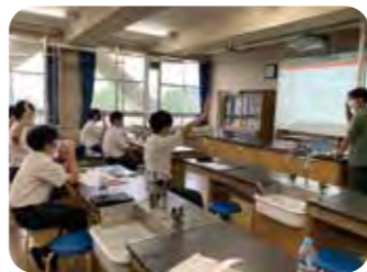
専門家からの講義