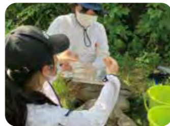
捕獲した生物の同定