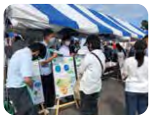
小牧市民まつりでの展示①