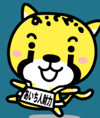
あいち人財強化プロジェクト イメージキャラクター 「アイチータ」

みなさんに大会のことを知ってもらうため、技能五輪に関する講話や競技職種に関連した技能を体験できる講座を開催します。ぜひ、参加してください！