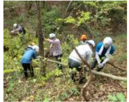
シデコブシ保全活動の様子