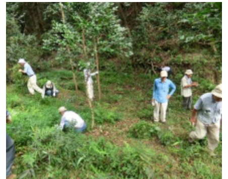
スミレサイシン保全活動の様子

今後も保全作業を実施し、専門家の指導・助言のもとにスミレサイシンの保全に努めていく。