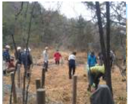
湿地保全活動の様子