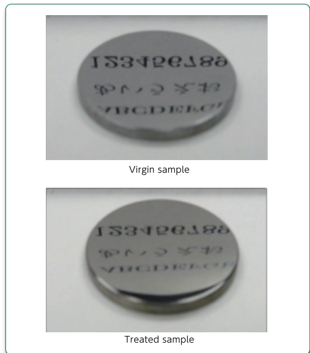
Fig.2 Hot-die steel treated by atom nitriding process