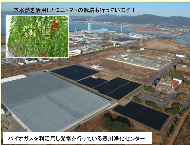
下水熱を活用したミニトマトの栽培も行っています！