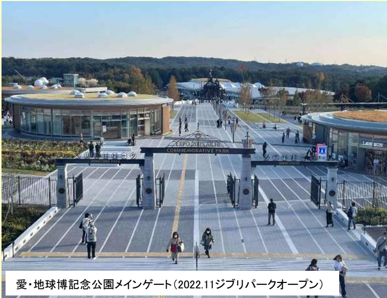
愛・地球博記念公園メインゲート(2022.11ジブリパークオープン)