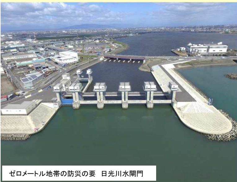
ゼロメートル地帯の防災の要 日光川水閘門