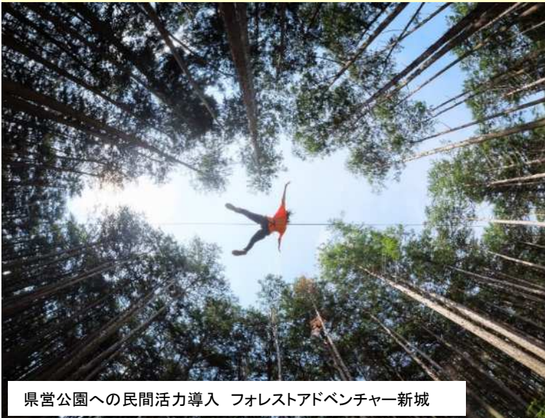
県営公園への民間活力導入 フォレストアドベンチャー新城