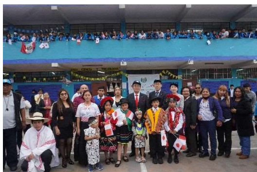
記念撮影(教職員ら)