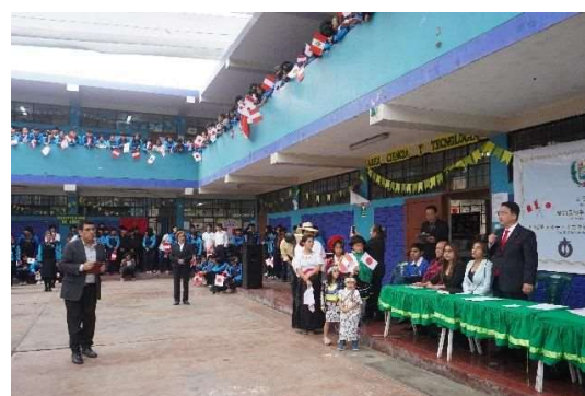
歓迎セレモニーでのスピーチ