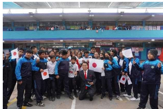
記念撮影(児童・生徒ら)