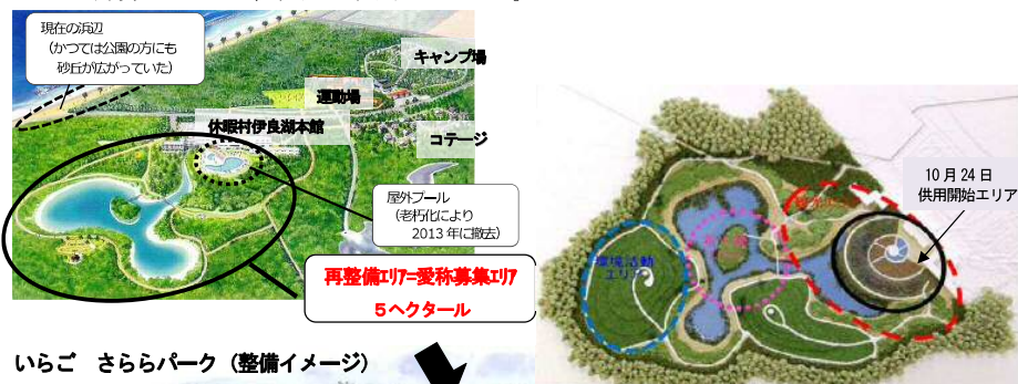
いらご さららパーク（整備イメージ）