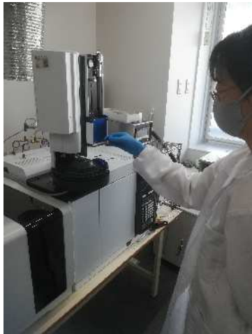
AIQS を活用した測定作業の様子