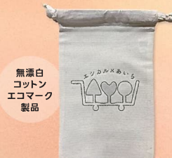
無漂白 コットン エコマーク 製品

キャンペーンに参加の上 いずれかのフェア会場へ来場 された方、各日先着50名様に 「エシカル×あいち」 ミニコットン巾着を プレゼント