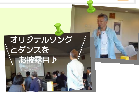
オリジナルソングとダンスをお披露目♪