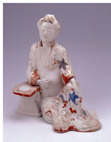
色絵婦人座像 江戸時代

春・秋の年二回、収蔵品の中から逸品を選んで特別に公開しています。今回は、膨大な名古屋城三の丸遺跡出土品のなかから選りすぐりの遺物を選んで展示します。