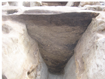
戦国時代(16世紀代)の堀断面 (6055D:2006年度調査)

同時開催 公益財団法人愛知県教育スポーツ振興財団 愛知県埋蔵文化財調査センター 令和5年度秋の埋蔵文化財展 名古屋城三の丸遺跡展 展示会場：愛知県埋蔵文化財調査センター2階 資料管理閲覧室