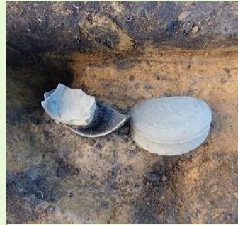
青山神明遺跡出土 須恵器