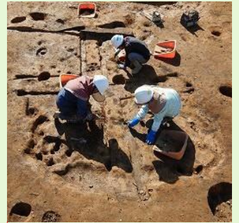
青山神明遺跡竪穴建物跡