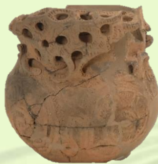
縄文土器深鉢 東光寺遺跡