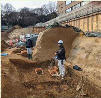
名古屋城三の丸遺跡 戦国時代の堀