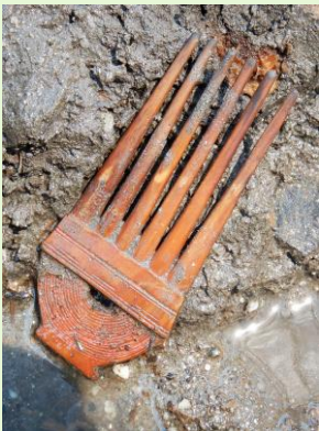
亀塚遺跡出土 竪櫛