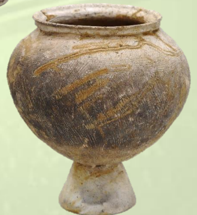
土師器台付甕 廻間遺跡