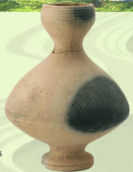
弥生土器細頸壺 一色青海遺跡