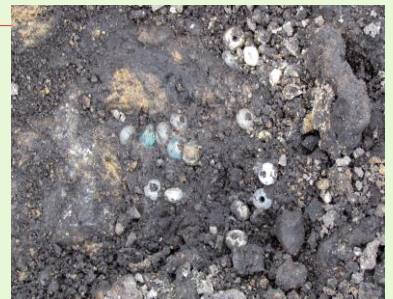
万瀬遺跡出土 ガラス玉(江戸時代)