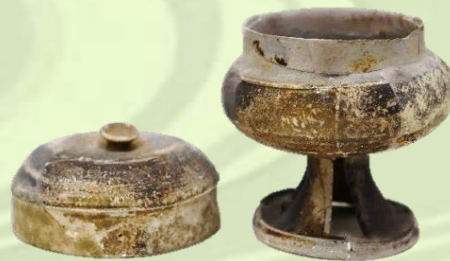
須恵器脚付壺 惣作・鐘場遺跡