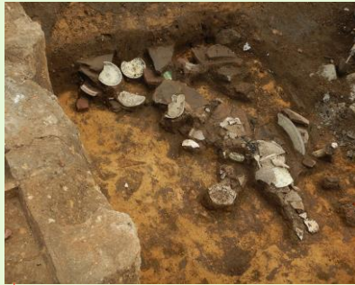
名古屋城三の丸遺跡 大型土坑