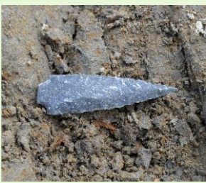
一色青海遺跡出土 石鏃