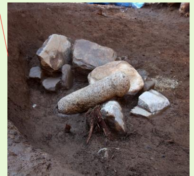
根道外遺跡出土 石棒