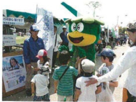
( PR活動の様子 )