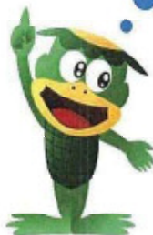
愛知県企業庁の水道マスコットキャラクター「カッパくん」