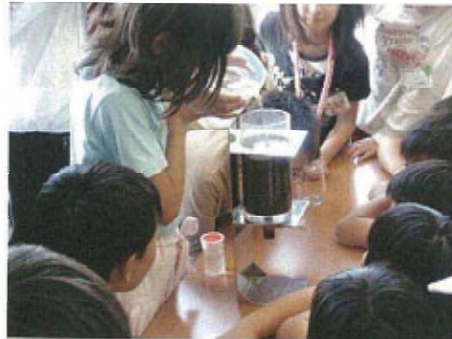
( 出張講座の様子（浄水実験） )

今年度は、平成26年6月3日（火）の尾張旭市立波川小学校を始めとして、年間20校程度で出張講座を実施する予定です。