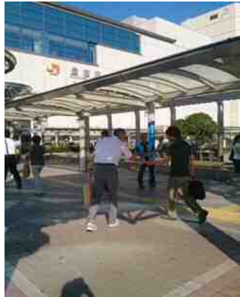
街頭での配布状況