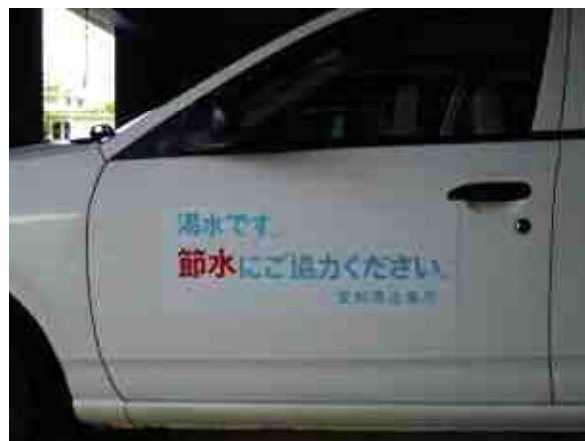
公用車ステッカー