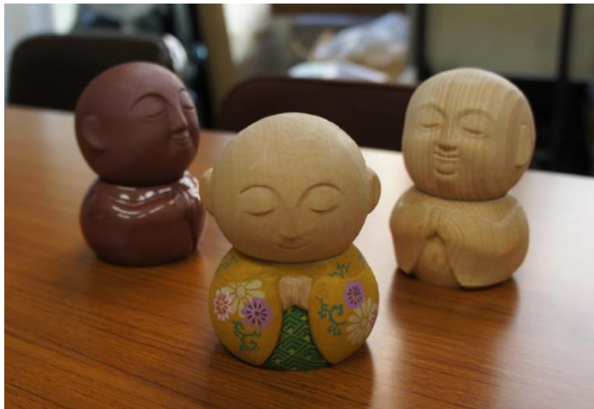
JIZO 試作品1 彩色