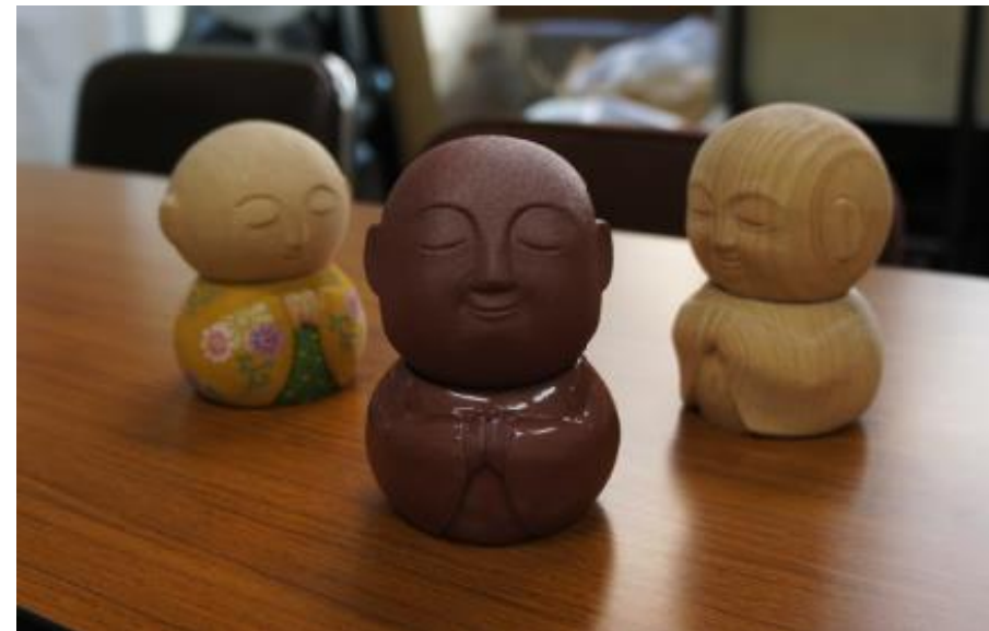
JIZO 試作品2 漆

節目のお祝いに送れるギフトとして、地蔵モチーフのオーナメントを製作。地蔵には、無病息災や交通安全など様々な祈願が込められており、加飾には吉祥文様などを取り入れる事で、エンドユーザーの購入動機をつくる。着色には、彩色や漆など、職人の技術を採用。地蔵のギフト、地蔵を身近に飾ってもらうという新しい提案を発信していく。