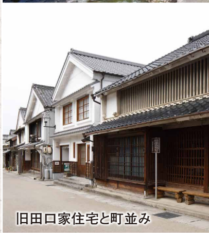
旧田口家住宅と町並み