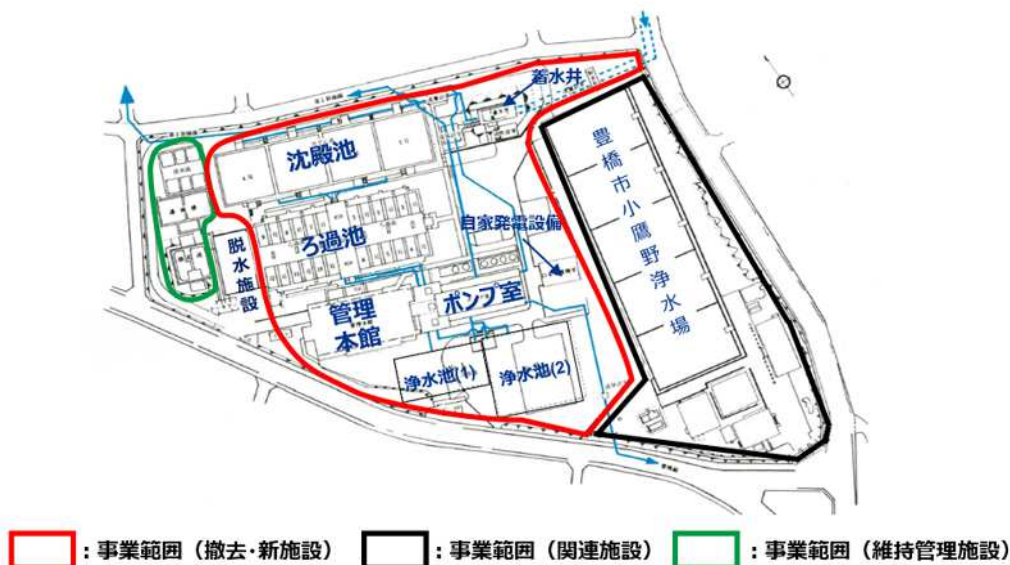
図表 2 概略の施設分類位置図