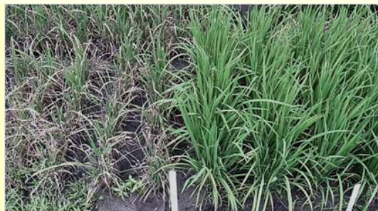
いもち病無防除激発圃場での栽培状況 (左:あきたこまち、右:中部134号)