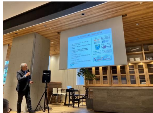
IMT Atlantique によるセミナーの様子 (2022年12月17日)