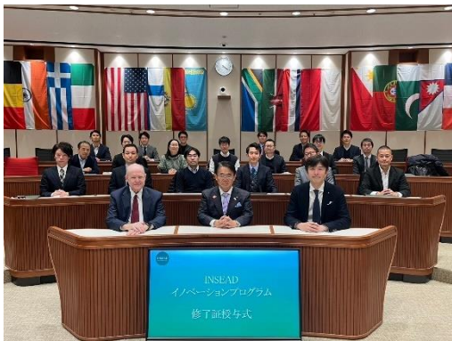
INSEAD イノベーションプログラム 成果報告会 (2023年12月15日)

2023年度は IMT Atlantique と県内大学とのイノベーション分野での協力に関する意見交換を実施。