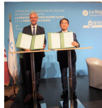
オーベルニュ・ローヌ・アルプ 地域圏との MOU 締結式の様子 (2022 年 5 月 19 日)