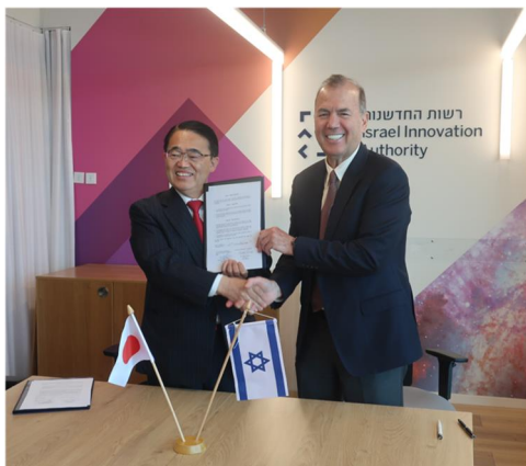
イスラエルイノベーション庁との合意書 締結式の様子（2022年5月22日）