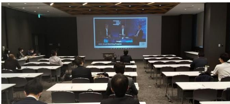
セミナーの様子（現地駐在員によるパネルディスカッション）

メッセナゴヤ 2022 において、駐日イスラエル大使館経済部と共催でイスラエルスタートアップとのオープンイノベーションの機運を醸成することを目的に、現地でイスラエルスタートアップと協業する日系企業の駐在員によるパネルディスカッションや、イスラエルイノベーション庁及びSNCから推薦されたイスラエルスタートアップによるピッチなど、イスラエルのイノベーションの最前線を伝えるセミナーを開催。