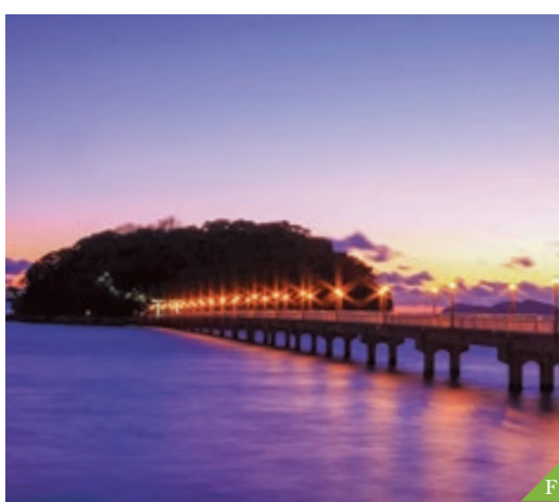
F 竹島 (蒲郡市) 這裏有因佑開運、安產和結緣而著名的神社，水族館以及美麗的自然，景點豐富。