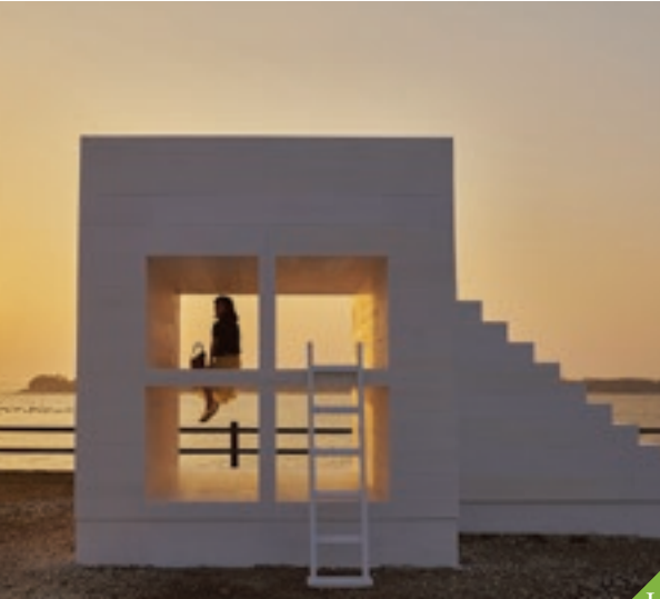
I 佐久島 (西尾市) 三河灣上的佐久島是可以享受海水浴和垂釣的小島。島上隨處可見藝術作品，與自然渾然一體的感覺也很特別。可以騎單車環島遊哦。