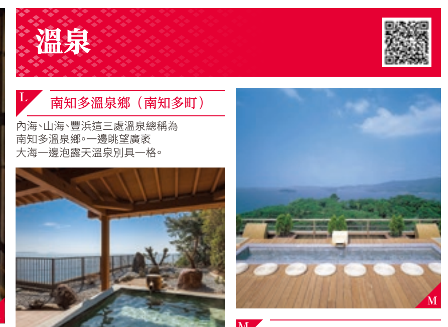
M 蒲郡溫泉鄉 (蒲郡市) 三谷、蒲郡、形原與西浦這4處溫泉街總稱為蒲郡溫泉鄉。周邊有主題公園等諸多景點。