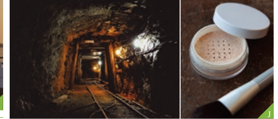
J “礦物粉餅手工製作體驗” naori (東榮町) 東榮町是粉餅原料絹雲母的產地。要不要嘗試從獨特原料開始製作自己的化妝品？