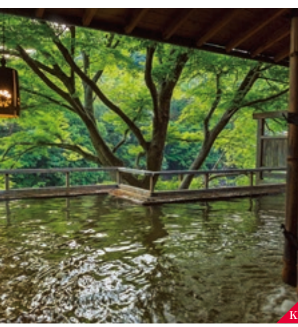
K 湯谷溫泉 (新城市) 在著名風景區的河邊靜靜地排列著各種日式旅館的溫泉街。