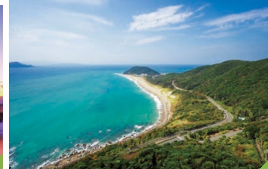
G 伊良湖岬 (田原市) 遼美半島尖端的岬角。離燈塔不遠的美麗沙灘“戀路之浜”，流傳著許多有關愛情的美麗傳說。