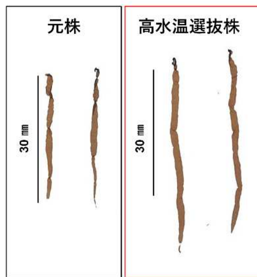
図2 高水温条件で培養した元株と選抜株ノリ