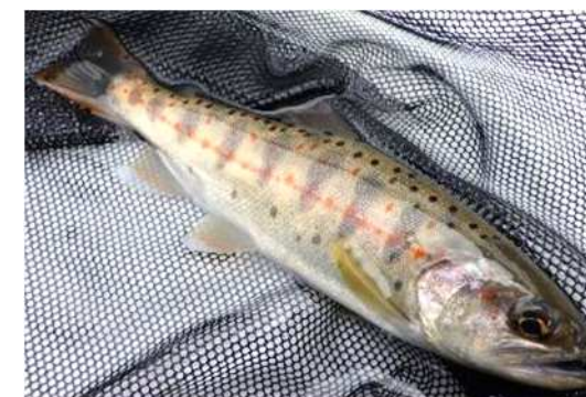
図3 釣りあげられたアマゴ

その結果、令和6年は20cm以上の大きい個体の割合が0～81%でしたが（図4上段）、令和7年は29～98%となり（図4下段）、釣れるアマゴが大きくなっていることが確認できました。さらに、令和7年7～9月には15cm未満の小さな個体が増えていました。これらは、前年に当グループが試験として放流した発眼卵によって増えたアマゴである可能性が高いと考えられます。また、1時間あたりに釣れる数も、令和7年は令和6年の約1.2倍に増えていました。今回の調査結果から、このような取り組みはアマゴ資源を効果的に増やしていることがわかりました。今後も調査を続け、川の環境に合わせた資源管理や増やし方の技術の開発をさらに進め、その成果を他の河川へ普及していきます。