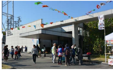
デジタルまつり (写真は昨年度の様子)