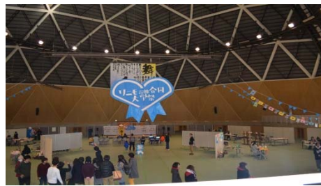
リニモ沿線合同大学祭 (写真は昨年度の様子)