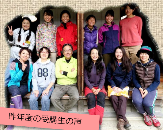
昨年度の受講生の声