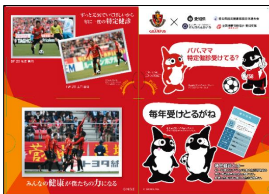
配布予定の「グランパスくん」 クリアファイル(ファイル表裏)