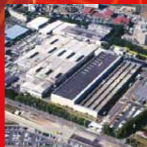
中央精機(株)本社事業所