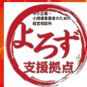
愛知県よろず支援拠点

主催: 愛知・名古屋産業立地プロモーション事業実行委員会(構成: 愛知県、名古屋市)