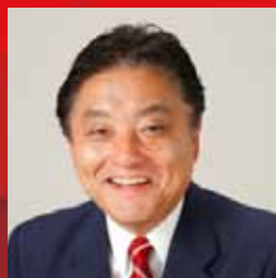
河村 たかし 名古屋市長