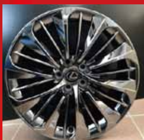
中央精機(株)製アルミホイール