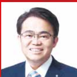
大村 秀章 愛知県知事