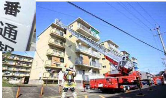
はしご車(レッドジラフ54)による救出訓練