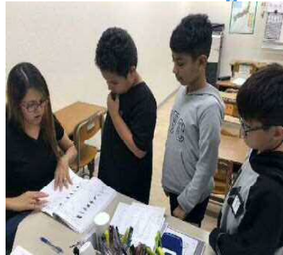
(虹の架け橋教室の様子)