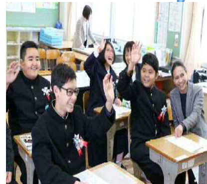
(日本語初期支援校「みらい」の様子)