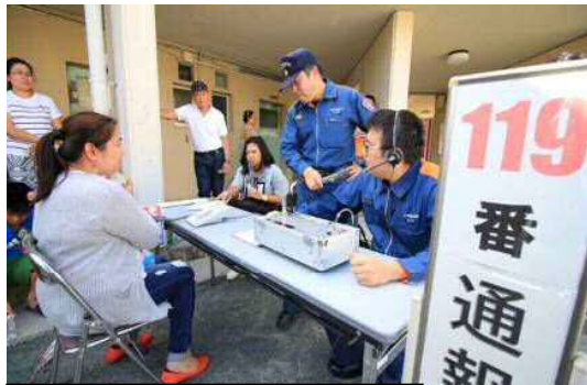
三者間同時通訳通報訓練