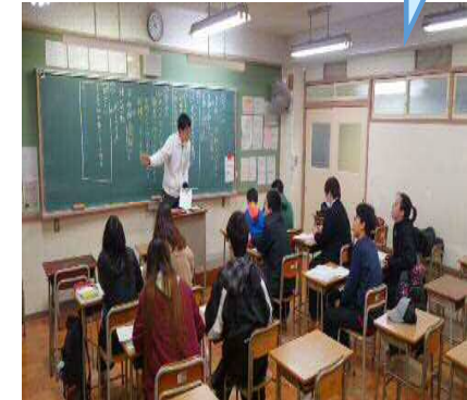
(高校生日本語学習支援の様子)