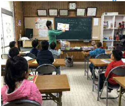
(プレスクールの様子)