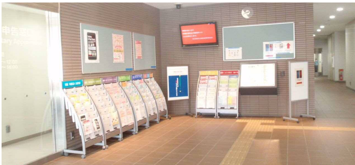
自治体情報コーナー（名古屋出入国在留管理局1階エントランス）