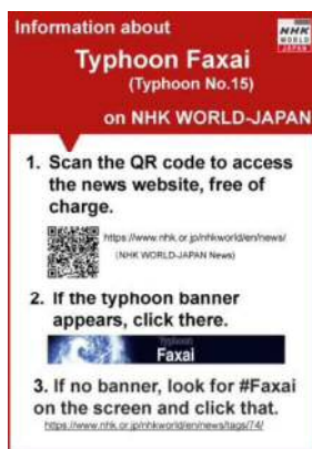
※台風15号 (Faxai) のチラシ

なお、ご利用いただいた場合は今後の外国人に向けた災害情報発信の参考にさせていただきますので、ご連絡いただけますと幸いです。