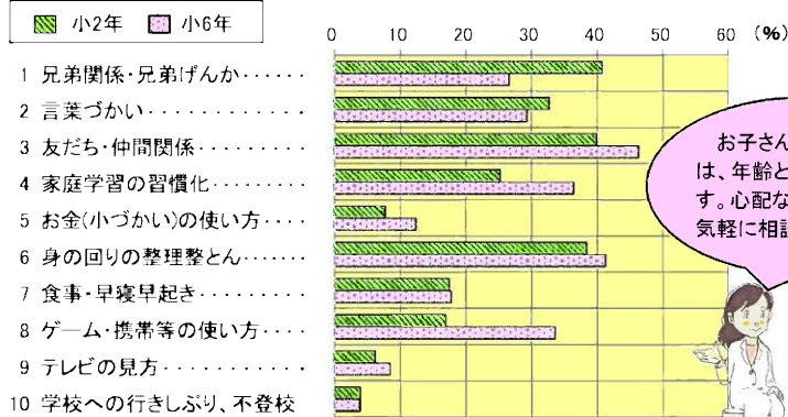
H25 家庭教育調査(愛知県教育委員会)

お子さんに関する悩みは、年齢とともに変化します。心配なことがあれば、気軽に相談してください。