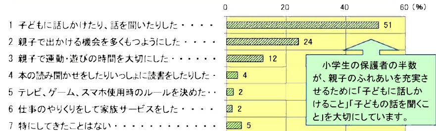
H25 家庭教育調査(愛知県教育委員会)

○小学校に入学して、お子さんが楽しみにしていること、家族が楽しみにしていることはどんなことですか。(ご家族で話し合ってみるのもいいですね。)