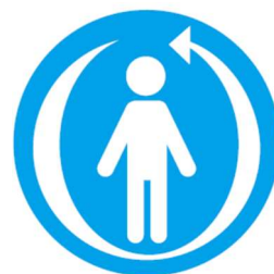
与生命周期相适应的 可持续支援