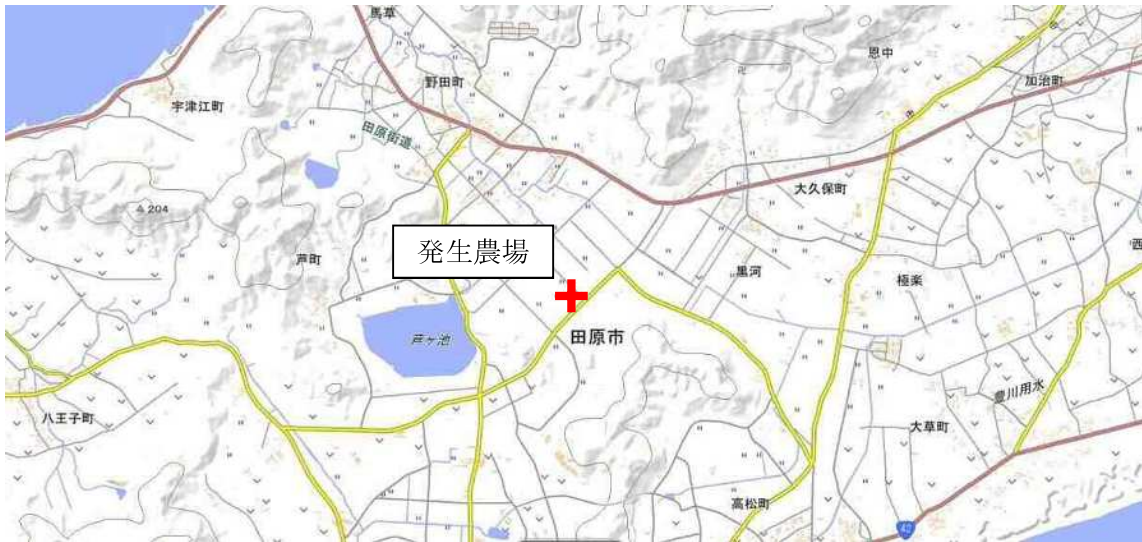
【発生農場の位置関係図】