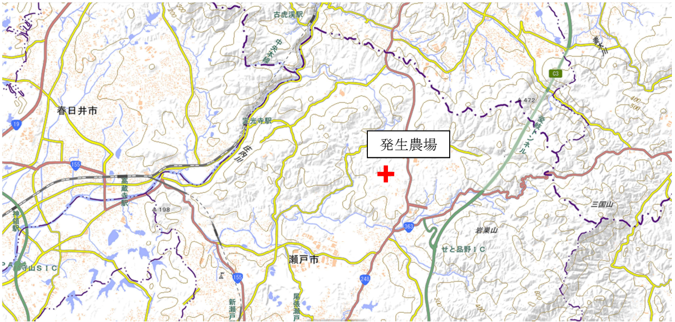
【発生農場の位置関係図】