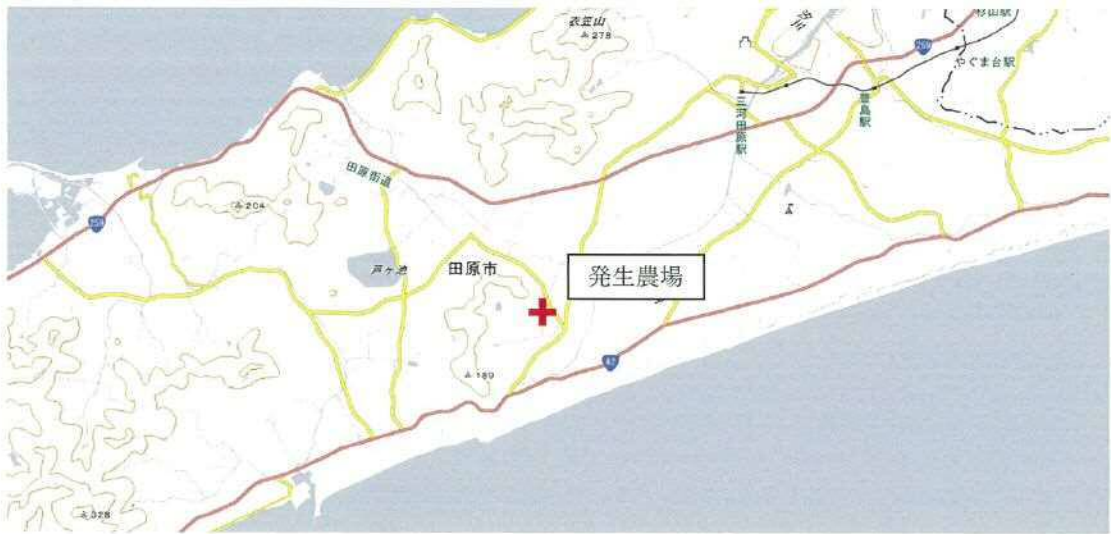
【発生農場の位置関係図】