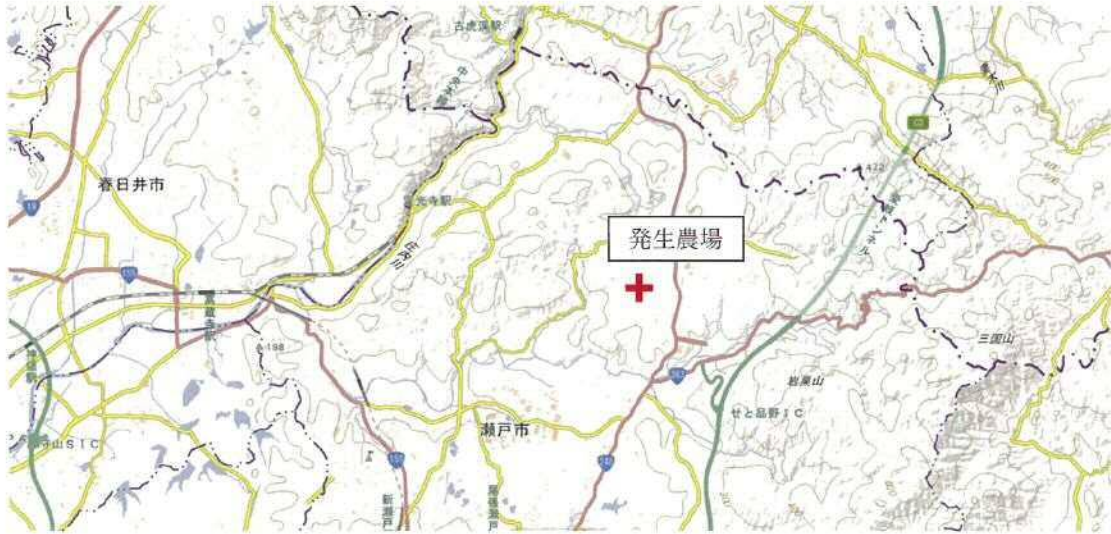
【発生農場の位置関係図】