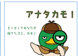
三重県 普及啓発動画