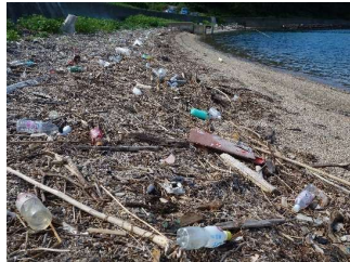
海岸に漂着したプラスチックごみ