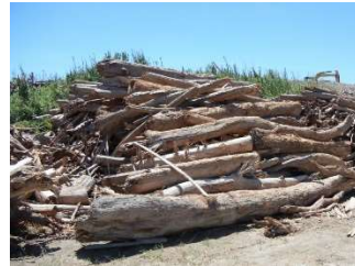
大雨後に港に積み上げられた流木

流域圏での海洋ごみ対策の推進により、伊勢湾の良好な景観や海洋環境の保全を図ることを目的に、岐阜県・愛知県・三重県が共同で本計画を策定