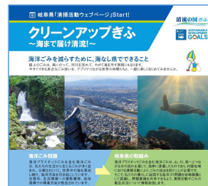
岐阜県 清掃活動ウェブページ