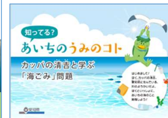
愛知県 環境学習プログラム