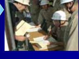
総合福祉センターで受付を行い、避難者人数を報告