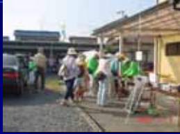
各地区一時避難場所に集合（避難者人数の確認）