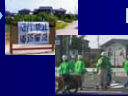
被害状況や要援護者の救出を地区ごとに想定