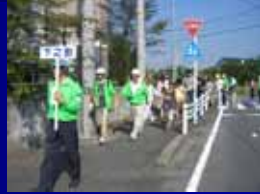
自治会役員、自主防災会役員の先導で避難