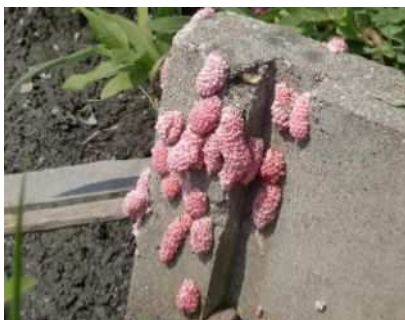
用水路（水口）の卵塊