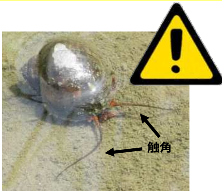
ジャンボタニシ（スクミリングガイ）