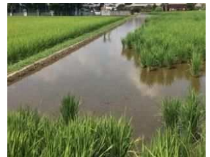
食害を受けやすい 入水口・排水口や周縁部（畦際付近）