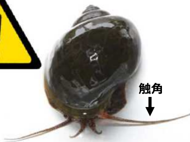
ジャンボタニシ (スクミリングガイ)