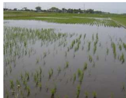
食害を受けた水田