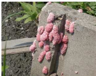
用水路（水口）の卵塊