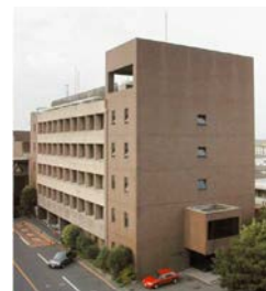
愛知県食品監視・検査センター Aichi Prefectural Food Inspection Center

*ルート1 名古屋駅 → 地下鉄 → 黒川駅 → 市バス → 北部市場 *ルート2 名古屋駅 → 名鉄 → 西春駅 → 名鉄バス → 北部市場北