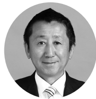
自由民主党 南部 文宏

12月5日、次の2人の議員が県政各般にわたる問題について、それぞれの会派を代表して質問しました。