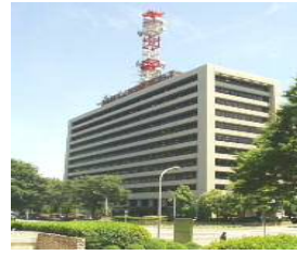
Local Autonomy Center December 1985