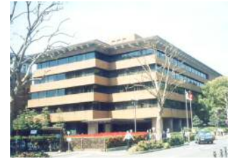
Assembly Building September 1975