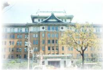
Main Building March 1938