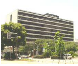
West Annex June 1964