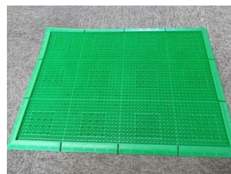
種子を落とすマット