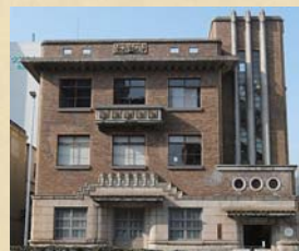
愛知県庁大津橋分室