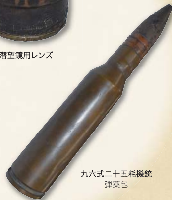
九六式二十五耗機銃 弾薬包