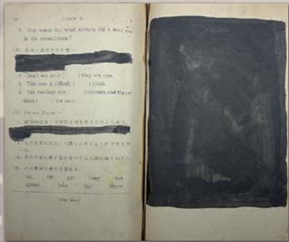
▲墨塗り・切り取り痕のある教科書『英語2』 (愛知教育大学附属図書館所蔵)