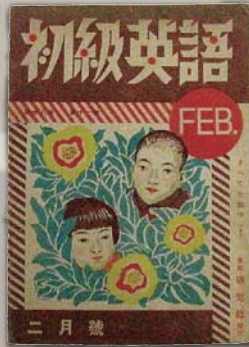
▲『初級英語(昭和18年2月1日発行)』