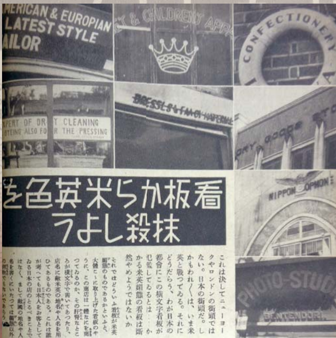
▲「米英色を一掃しよう」という特集が組まれた『写真週報』257号

アジア・太平洋戦争のさなか、街なかや日々の暮らしから、「敵国」の言葉である英語は、しだいに姿を消していきました。それでは、学校でも英語の授業は消えていったのでしょうか？ 答えは「ノー」です。 実は戦争末期まで、中学校などでは文部省検定の教科書を使って英語の授業がおこなわれていました。ただし、軍国主義的な内容の教材も採用されていたものの、帝国議会でも英語教科書の内容が「親英米的」であるとして追及されるといふ一幕もありました。 戦争が終わると、軍国主義的な内容の箇所は墨を塗ったり、数ページにわたって切り取られて使用されたりしました。今回の企画展では、当時の教科書や雑誌を取り上げながら、戦中・戦後の英語教育のたどった足跡を追います。