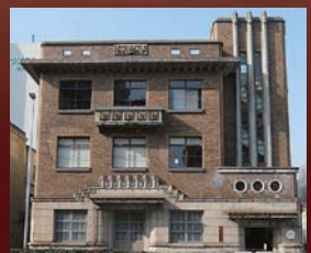
愛知県庁大津橋分室