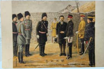
通信省の 日露戦役絵葉書

現在、遠く離れた人とつながるには、電話やインターネットを介したメール、SNSなど様々な手段があります。そうした手段ができる前は手紙が人と人をつなぐ最たる手段でした。戦時下においては、徴兵や動員、疎開などで家族が離れ離れになりました。時に手紙は、相手の生死を確かめる唯一の手段だったのです。しかし、戦争が長期化するにつれ、郵便従事者の不足や輸送手段の確保が深刻となり、自由に郵便を利用することも難しくなります。 今回の企画展では、戦時下の郵便事情をパネルで紹介するとともに、疎開先の児童が母に宛てた手紙、戦地の兵士が家族に宛てた手紙など、当館所蔵の実物資料を展示します。