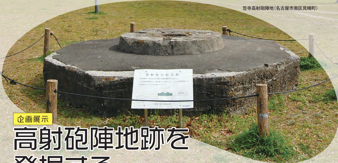
笠寺高射砲陣地(名古屋市南区見晴町)