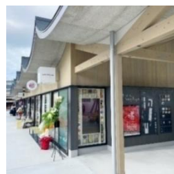
県産木材を使用した商業施設「あつた nagAya」