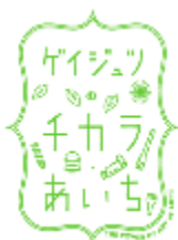
あいちアール・ブリュットのロゴマーク