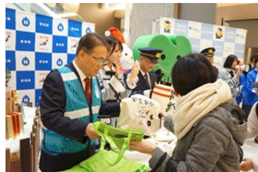
年末の安全なまちづくり特別啓発活動