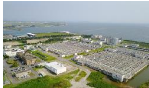
矢作川浄化センター