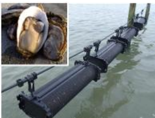
かきのシングルシード式養殖

さらに、生態系を含めた海洋環境の悪化や海岸機能の低下等を引き起こす海洋ごみへの対策として、漂着ごみの組成調査や発生抑制のための普及啓発を実施するとともに、市町村が行う海洋ごみの回収・処理や普及啓発を支援します。