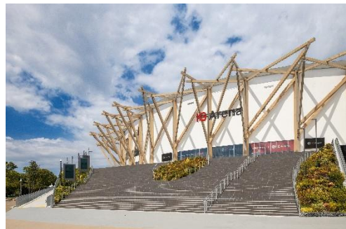
IGアリーナ（愛知国際アリーナ）