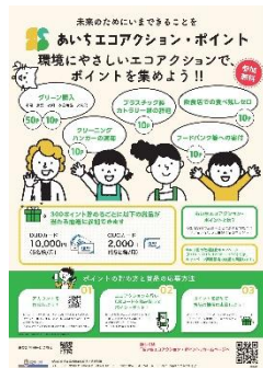
あいちエコアクション・ポイント

その他、公共工事でリサイクル資材を多く利用するため、基準を満たす資材をあいくる材として認定する愛知県リサイクル資材評価制度を運用します。