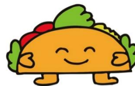
愛知県多文化共生シンボルキャラクター タコスくん