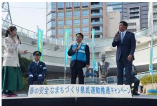
春の安全なまちづくり県民運動

さらに、警察活動では、県内各地域にある45の警察署を拠点として、犯罪の予防や検挙、交通の安全指導や取締りなど県民の生命や財産を守るための活動をたゆまず行います。SNS上で実行犯などを募集する闇バイトによる犯罪の発生を防ぐため、SNS上の違法・有害投稿に対して、返信機能を活用した投稿者への個別警告を一部自動化し、運用しています。