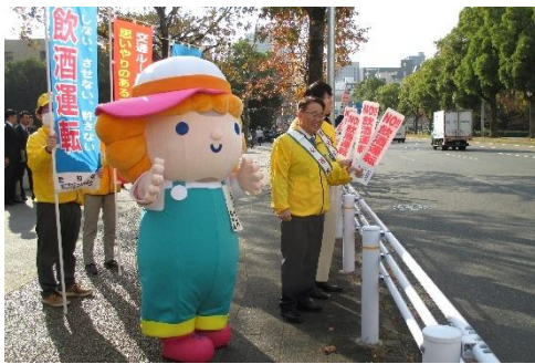
交通安全県民運動

その他、愛知・名古屋のシンボルとなるIGアリーナ（愛知国際アリーナ）から、世界最高峰のスポーツ・エンターテインメントを発信していきます。