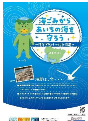
海洋ごみ発生抑制普及啓発リーフレット