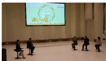
介護予防のための通いの場に関するフォーラム

新型コロナウイルス感染症については、ワクチンの副反応や罹患後の後遺症に関する相談窓口を引き続き設置するとともに、適時適切に必要な対策を実施します。