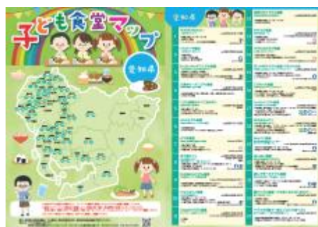
愛知県子ども食堂マップ