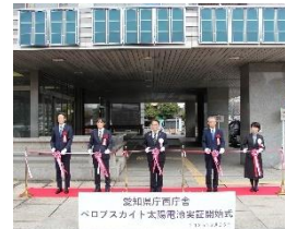
愛知県庁西庁舎ペロブスカイト太陽電池 実証開始式