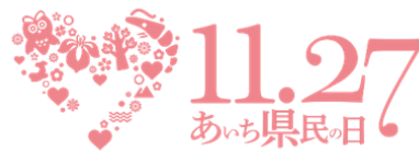
あいち県民の日ロゴマーク