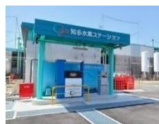
水素ステーション

その他、住宅用地球温暖化対策設備の導入補助制度により、太陽光発電施設や住宅の断熱性能等をも高める設備等の導入を支援するとともに、「あいち次世代バッテリー推進コンソーシアム」を中核に、研究・実証、人材育成、製造拠点等の集積に向けた事業を実施します。