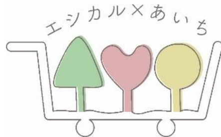
愛知県エシカル消費ロゴマーク