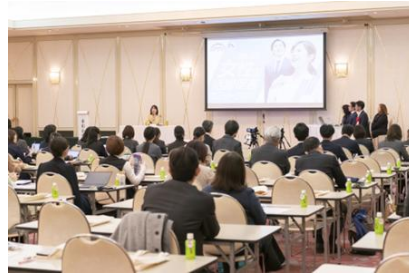
女性の活躍促進サミット 2025