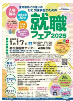
ひとり親家庭のための就職フェア

さらに、子どもの貧困対策として、児童養護施設等で生活する児童の大学等への進学や運転免許取得等に要する費用を支給するとともに、子ども食堂の開設・物品更新等の支援や、学習支援、居場所の提供に取り組みます。